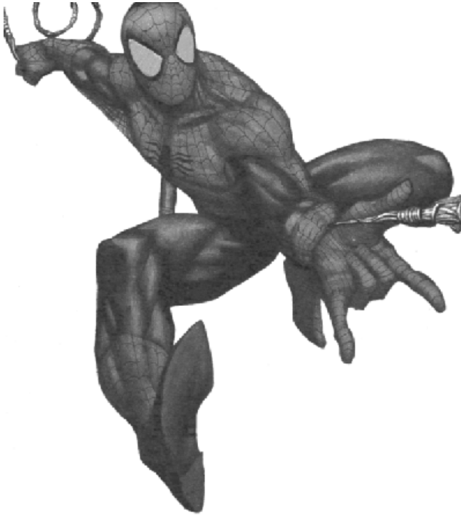
CLOSE-UP, NEDERLAND 1, 18.32-19.29 UUR